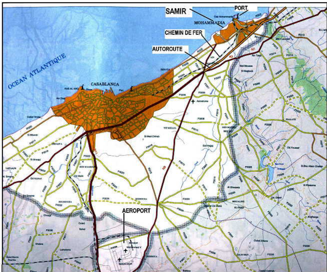
Graphique E2: Localisation de la raffinerie SAMIR à Mohammédia

4.2 L'embouchure du fleuve El Maleh Oued se situe à environ 1 km du site au nord-est, à mi-chemin entre la raffinerie et le port de Mohammédia. La zone qui entoure la raffinerie est essentiellement industrielle et ne compte que quelques propriétés résidentielles à proximité du site. Le centre urbain le plus proche est Ain Harrouda situé à 6 km au sud. Une digue de sécurité a été construite à l'est du site pour protéger la raffinerie des inondations.